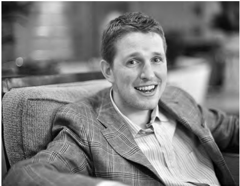
Matthew Mullenweg – der Vater von WordPress.

Dank »guter Pflege« wurde es schnell populär und inzwischen bieten er und seine Mitstreiter unter dem Namen AUTOMATTIC Dienstleistungen rund um WordPress an. Matt fotografiert, musiziert und bloggt leidenschaftlich gern, Letzteres übrigens unter der Adresse http://ma.tt/about . Da Matt Jazzmusik liebt, trägt jede neue WordPress-Version den Namen eines Jazzmusikers. WordPress 1.0 hieß »Miles Davis«, Version 2.7 wurde nach dem berühmten Saxofonisten »John Coltrane« benannt und Version 3.5 erhielt den Namen des Jazzmusikers »Elvin Jones«.